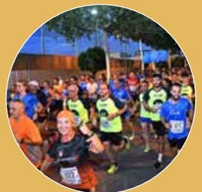
Ganadores de la XXIV Carrera Popular Nocturna 'Ciudad de Alcalá'