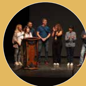
Clausura del proyecto RAP