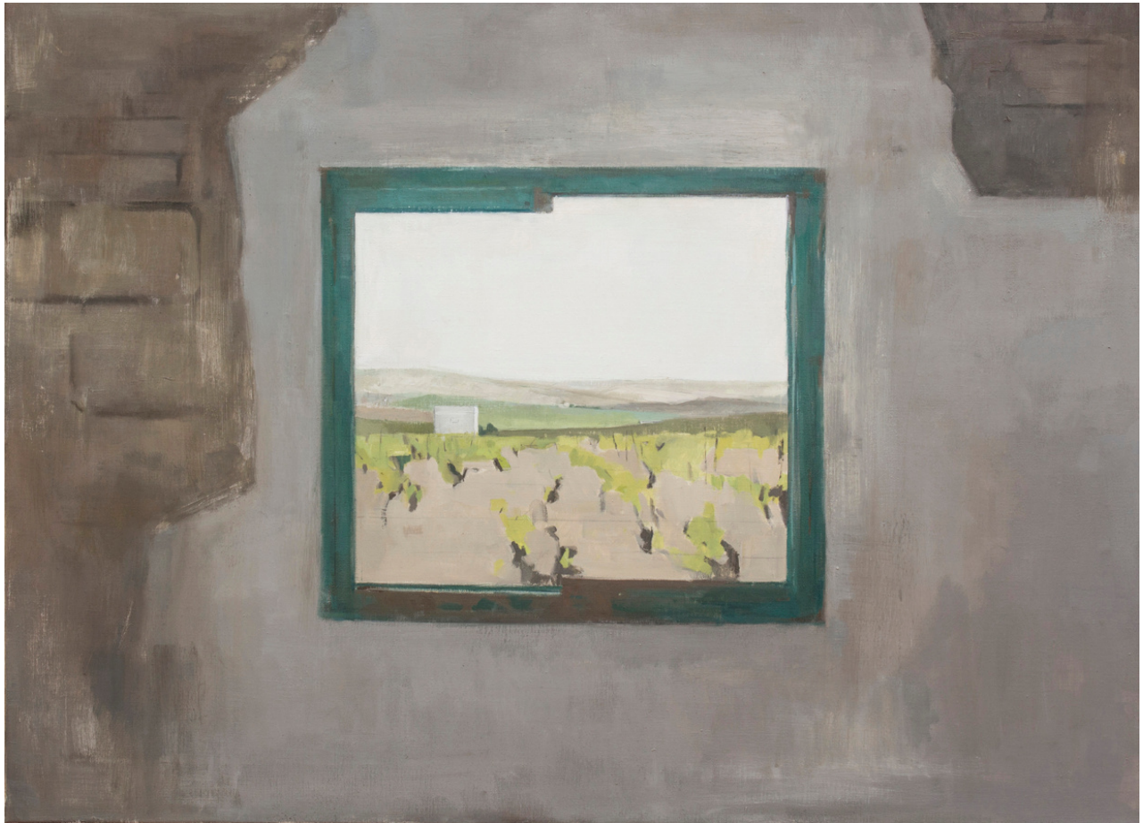
Rocío Cano Guzmán Paisaje desde la ventana. Óleo sobre lienzo, 73 x 100 cm.