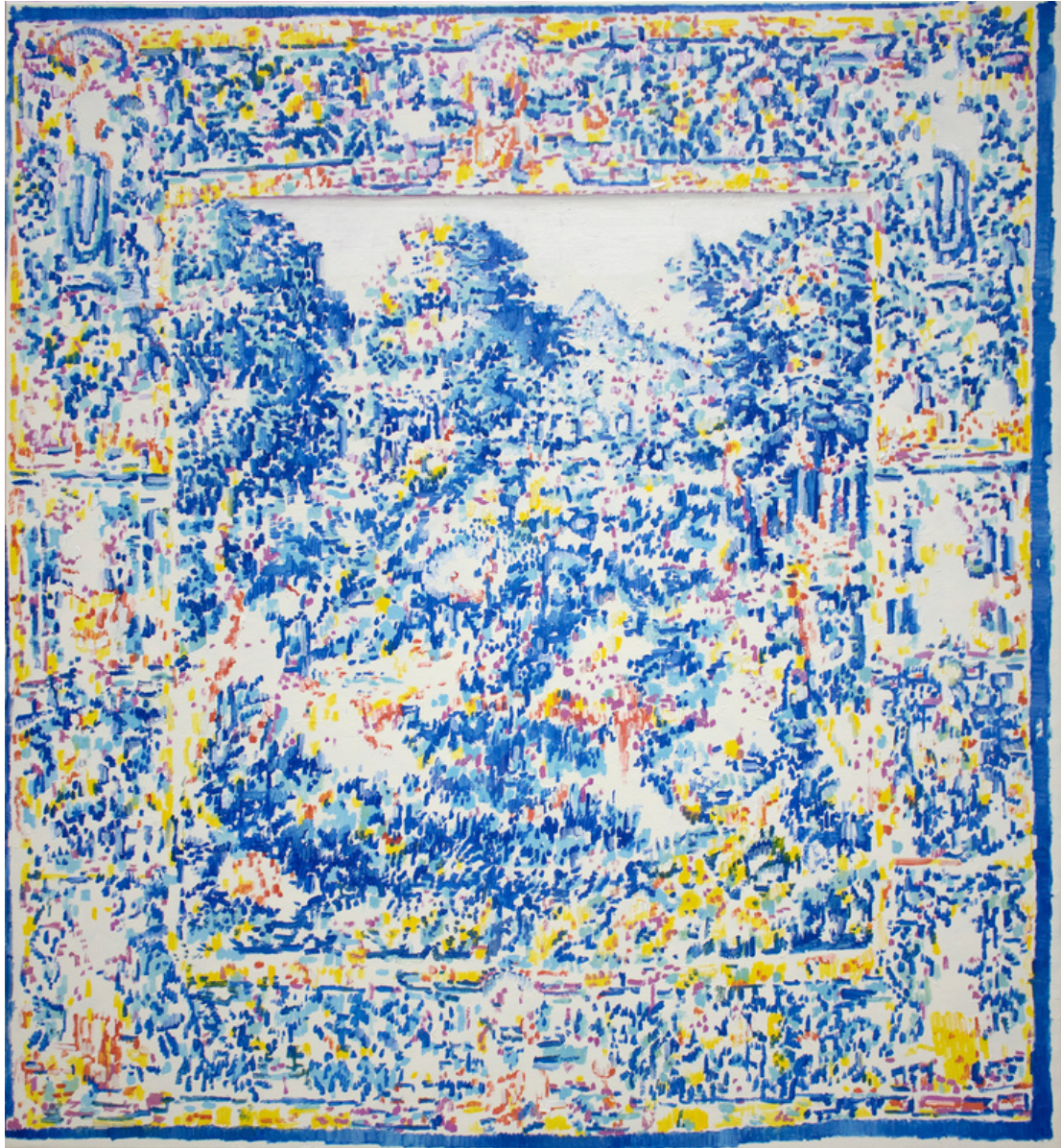
Armando Gutiérrez Rabadán Montaña azul . Óleo, spray sobre lino, 146 x 130 cm.