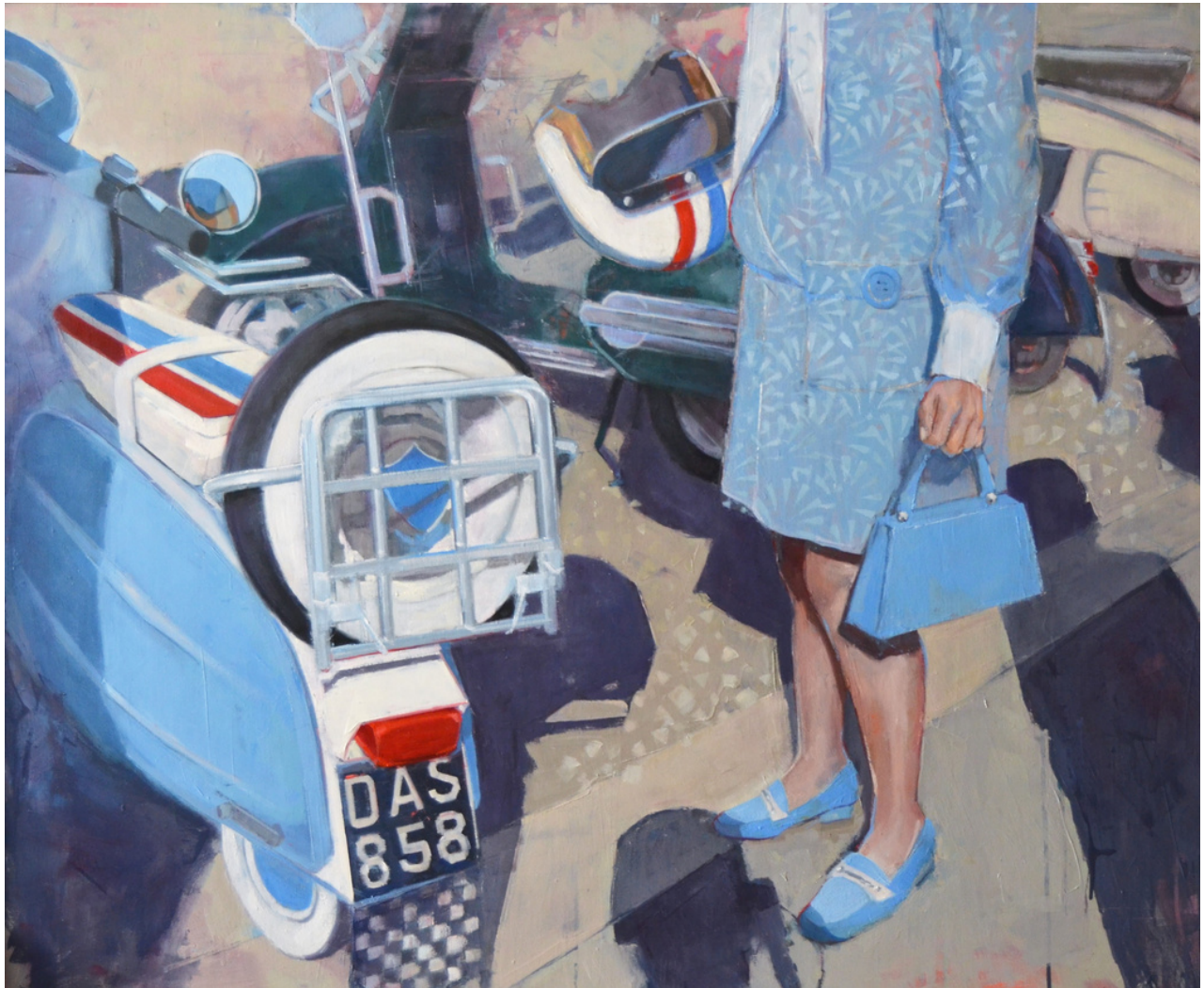
Carmen Lupión Morales La vespa . Técnica mixta sobre tabla, 100 x 120 cm.