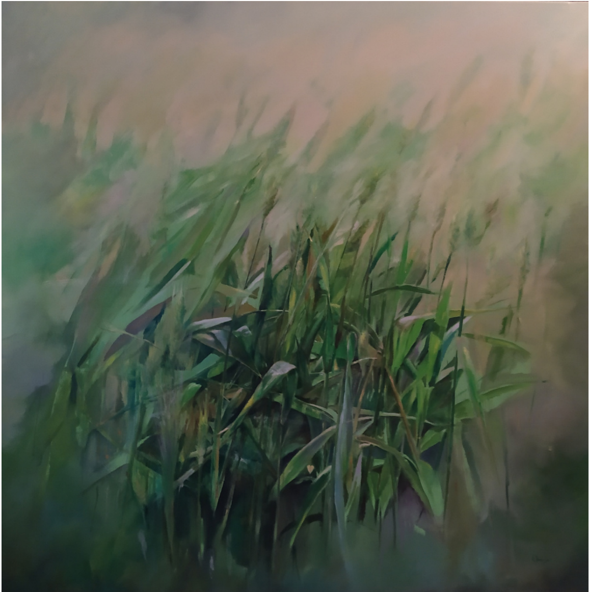
Antonio Dorado Guerra Trigo verde . Óleo sobre lienzo, 116 x 116 cm.