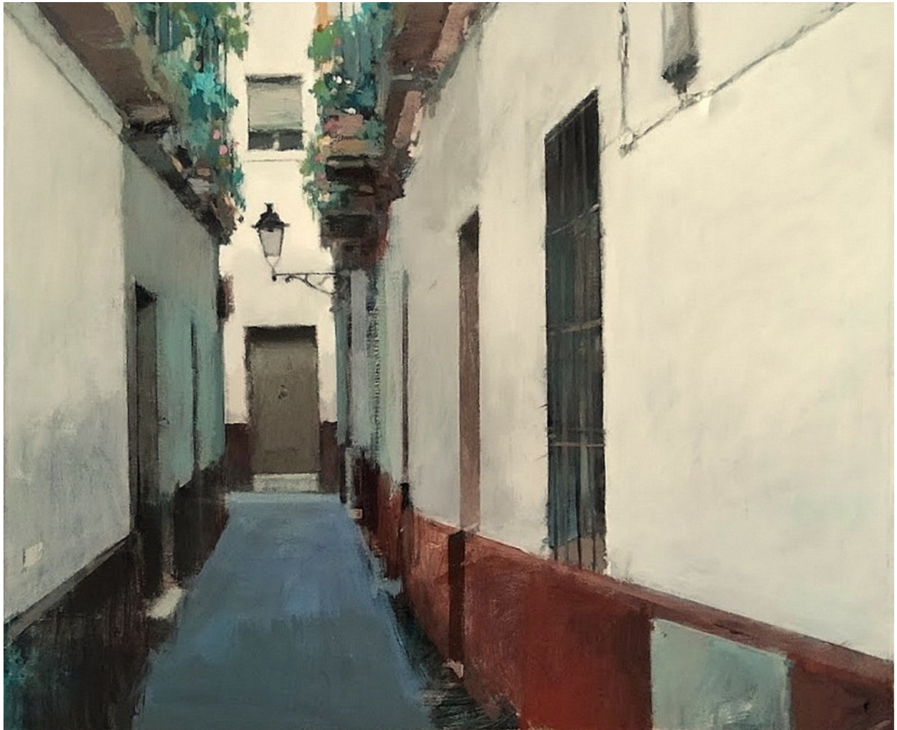
Francisco Martín Barea Callejuela . Acrílico sobre lienzo, 60 x 73 cm.