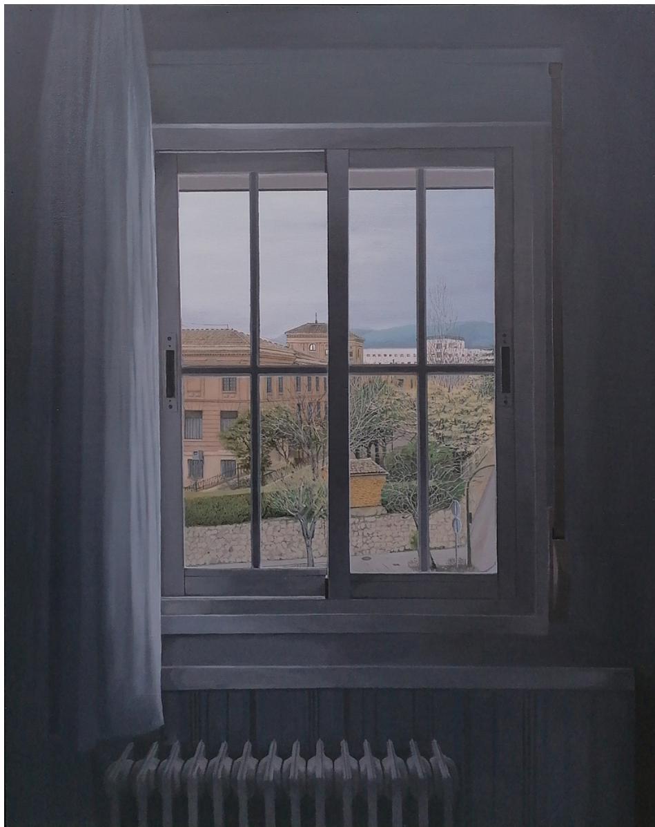
Rafael Torres Ruano La Facultad desde mi ventana. Óleo sobre tabla, 100 x 80 cm.