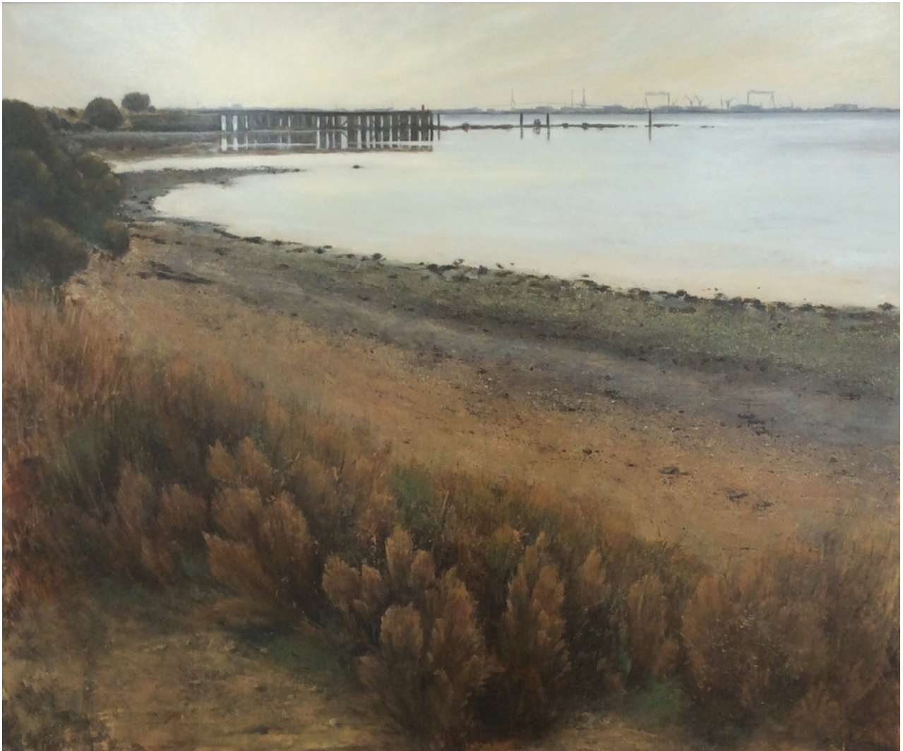
Juan Pérez Bey La casería . Óleo sobre tabla, 100 x 120 cm.