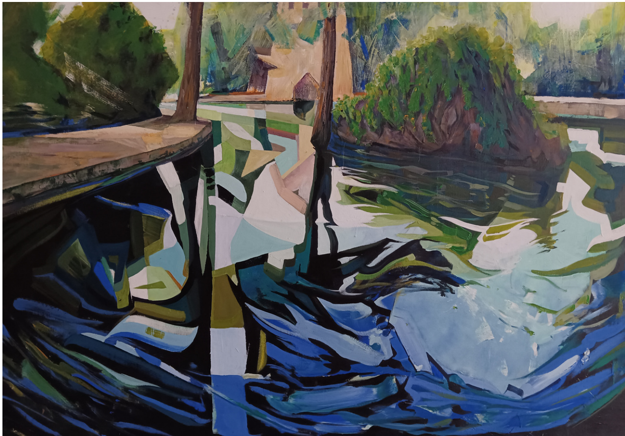
Abel Villén Fernández Recuerdos en fase Rem . Técnica mixta sobre lienzo, 108 x 150 cm.