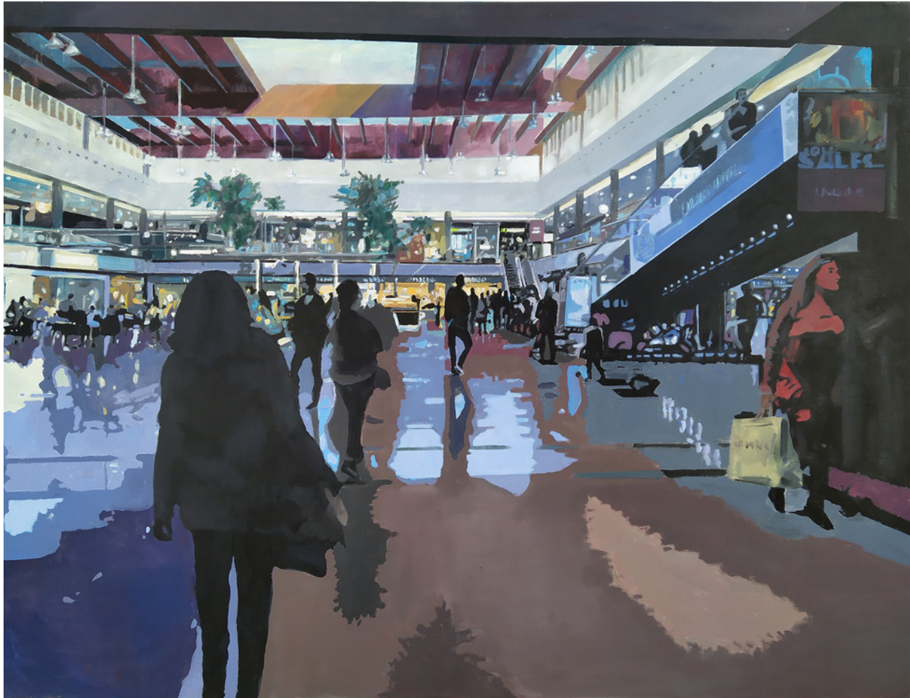
Rafael Cerdá Martínez Centro comercial. Acrílico sobre lienzo, 114 x 146 cm.