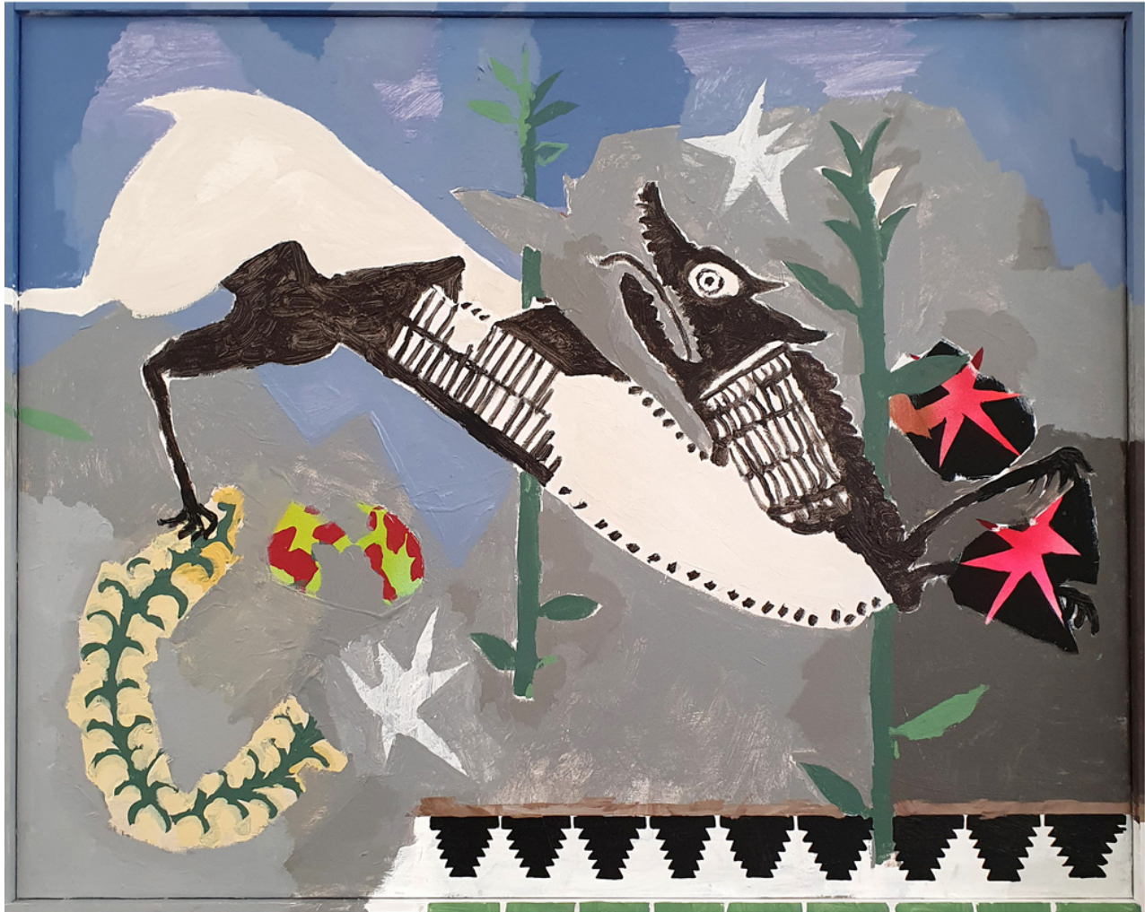
Agus Díaz Vázquez Despeñaperros . Acrílico sobre lienzo, 75 x 94 cm.