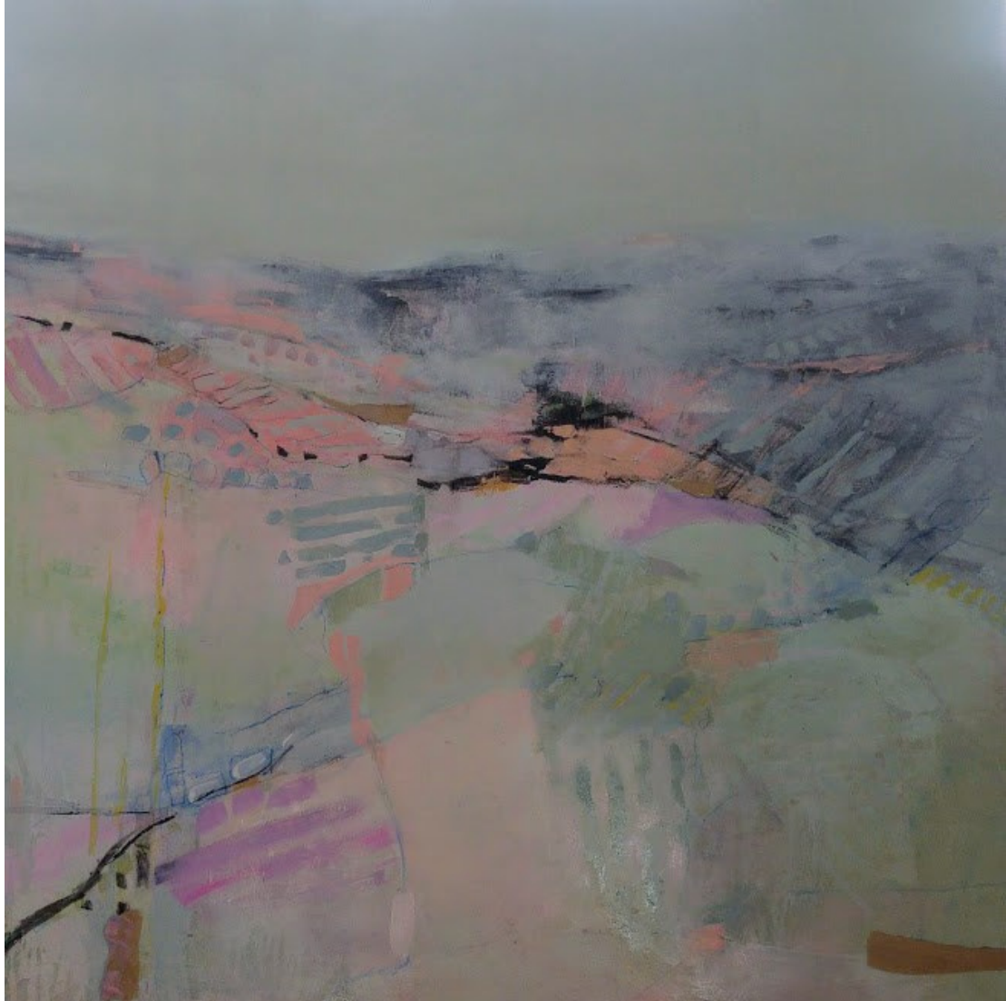
Dolores García Campos Campos en la niebla . Técnica mixta sobre tabla, 100 x 100 cm.