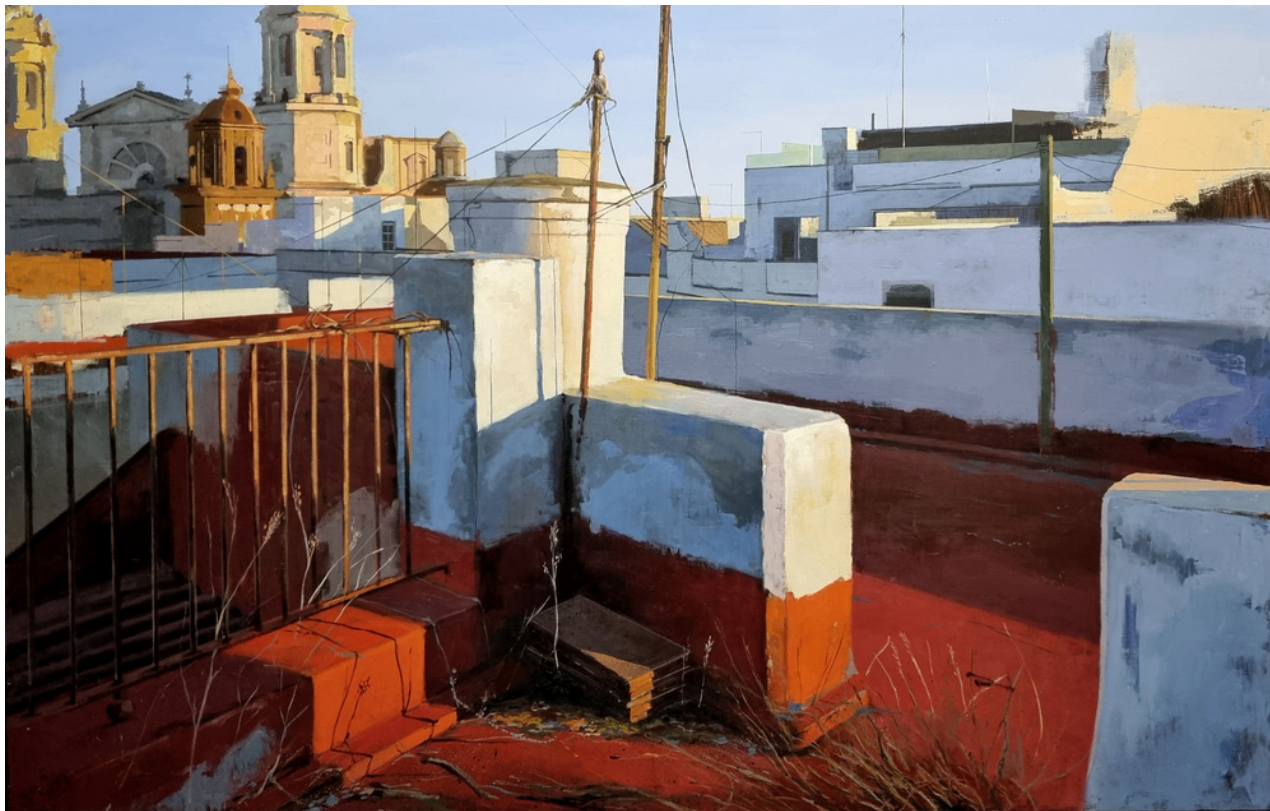
Cecilio Chaves Aparicio Cádiz IV . Óleo sobre lino, 100 x 140 cm.