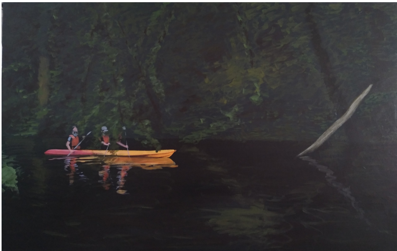
Santiago Castillo Trigo Guadaíra 2.0 . Acrílico sobre tabla, 73 x 114 cm.