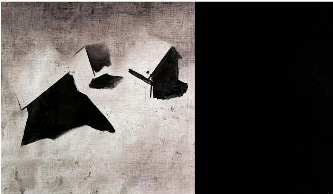
Israel Tirado García Ficción urbana. Óleo sobre lienzo, 90 x150 cm.