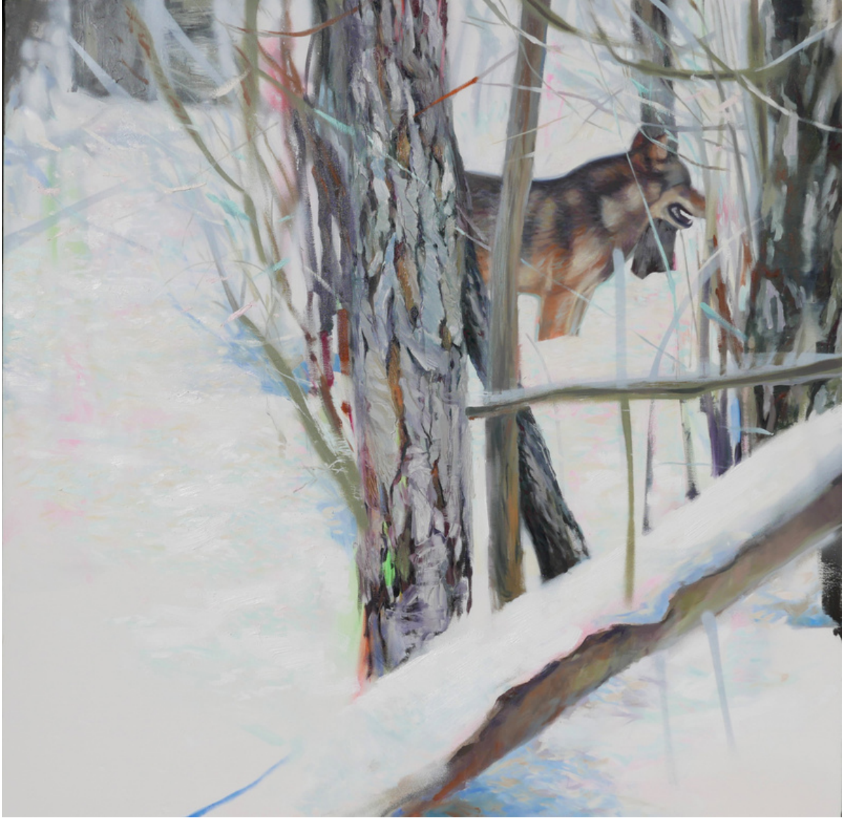
Mª. Teresa Durá Sepulcre Cuando llega el invierno. Técnica mixta sobre lienzo, 120 x 120 cm.