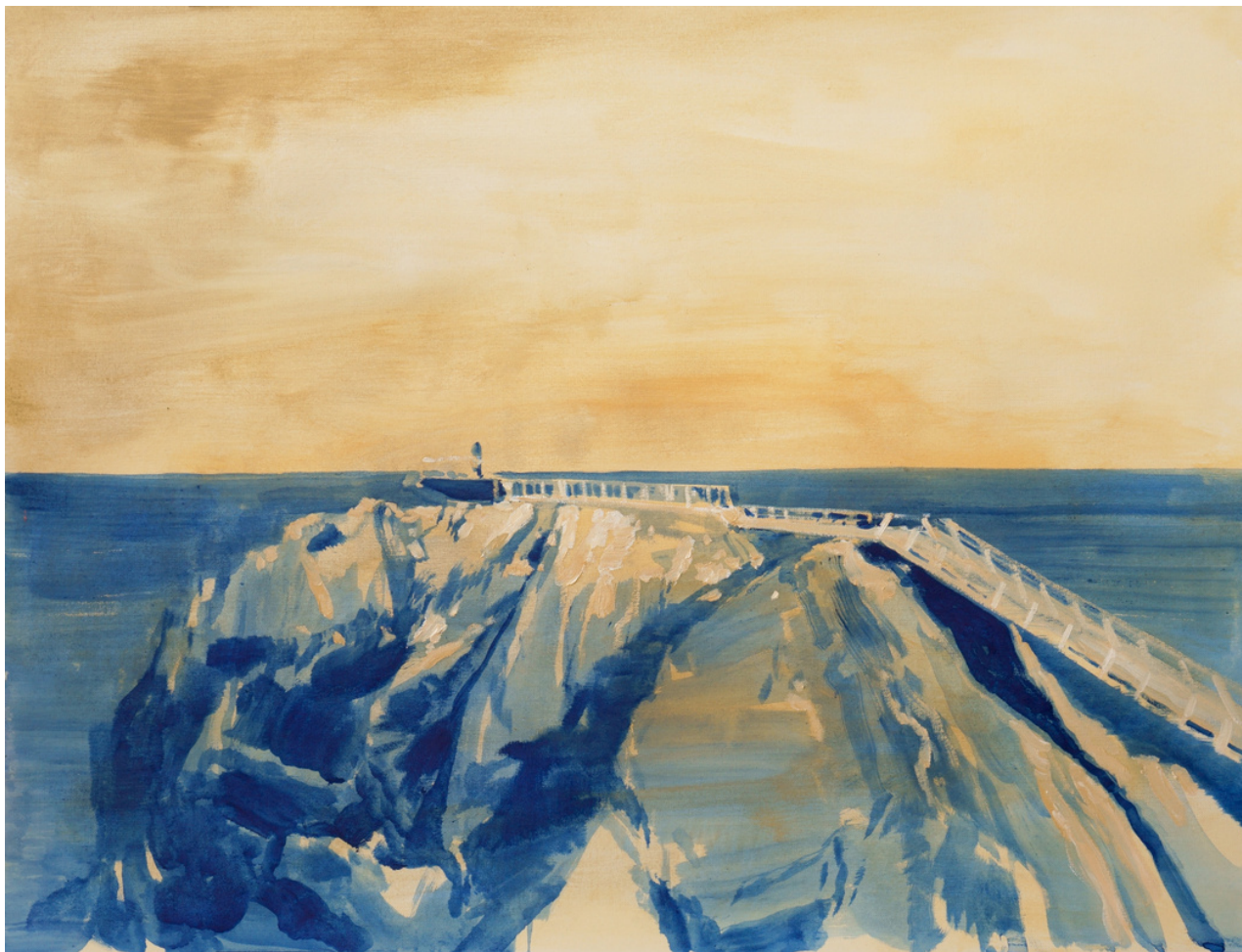
Diego Carmona Roldán El Mirador . Óleo al agua sobre papel, 50 x 65 cm.