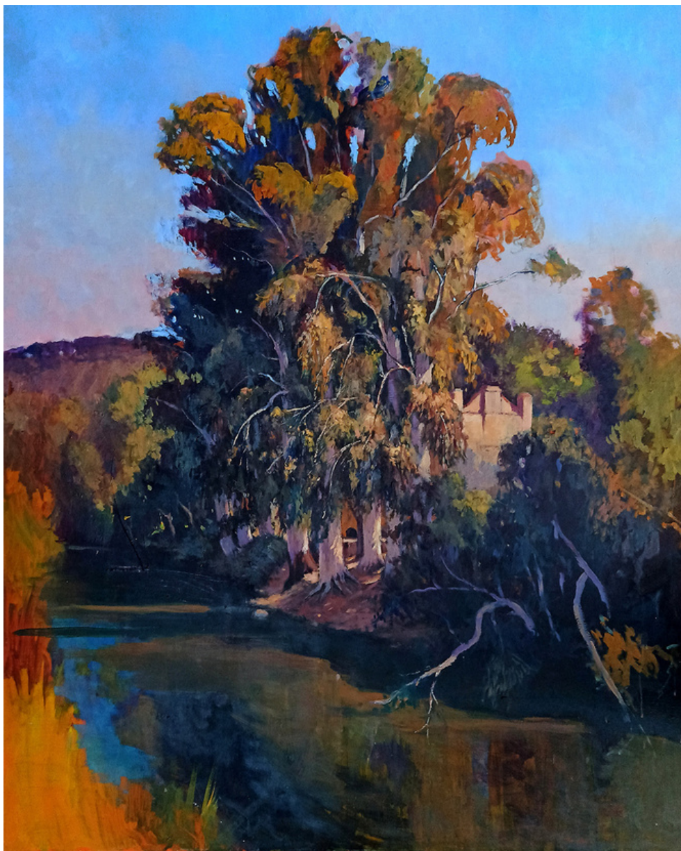
Miguel Ángel Márquez Pérez Desde el puente. Óleo sobre lienzo, 100 x 81cm.