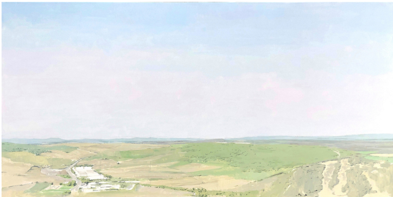
Carmen Chofre García Horizonte . Óleo sobre lienzo, 73 x 140 cm.