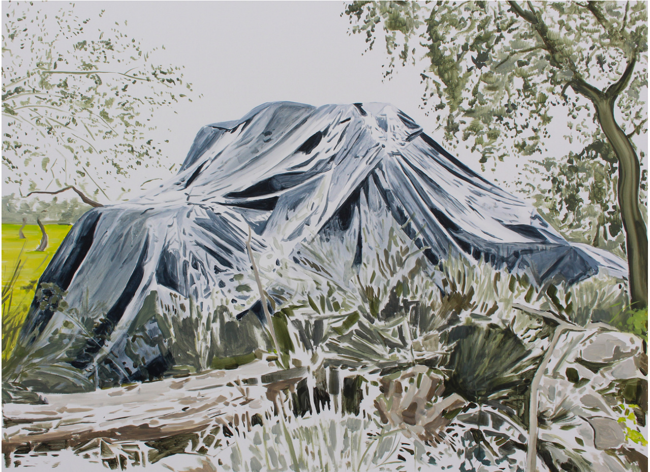
Ismael Barroso Franco Niara . Acrílico sobre lienzo, 73 x 140 cm.