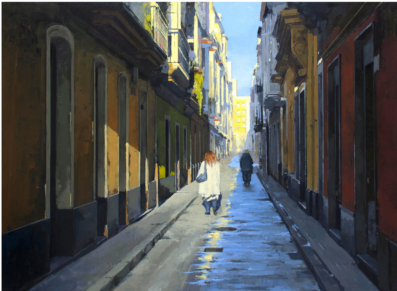
Cecilio Chaves Aparicio Benjumeda 2 . Óleo sobre tabla, 60 x 82 cm.