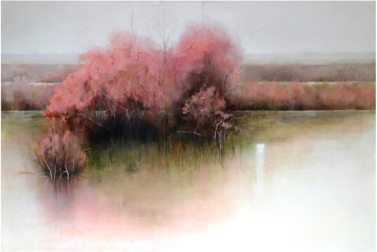
Cristina Díaz García Tarajes del Caño Guadamar . Técnica mixta sobre madera, 100 x 150 cm.