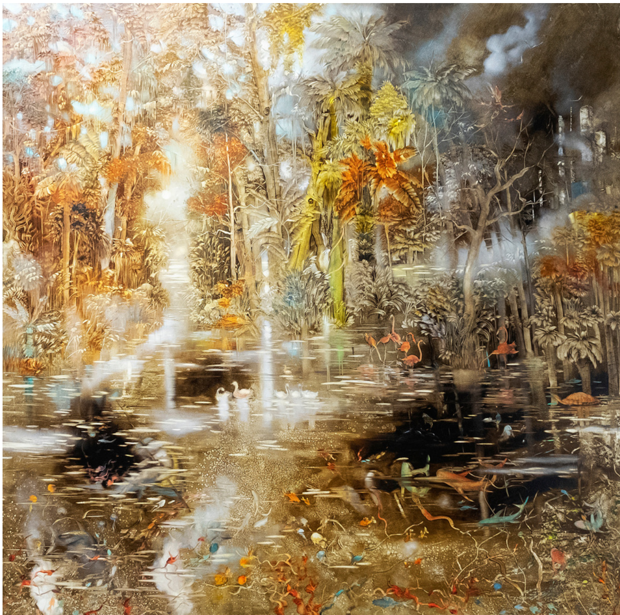
Mayra D'Amore Manglar . Óleo sobre tabla, 100 x 100 cm.