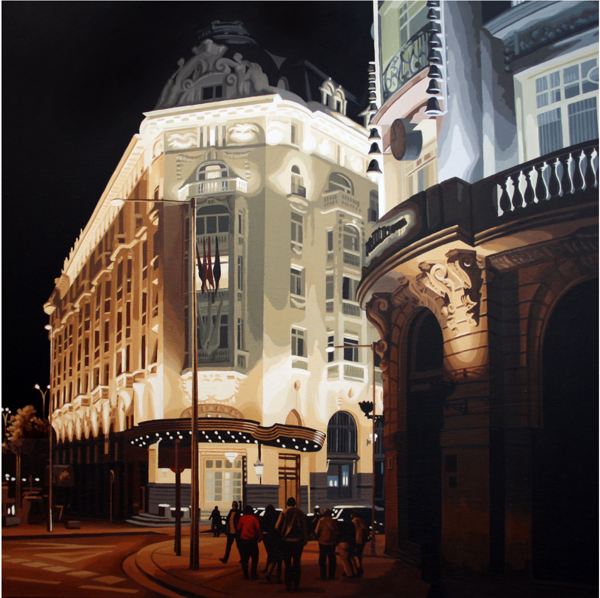
Rosa Ana Martos Sitcha Palace Hotel . Acrílico sobre tabla, 114 x 114 cm.