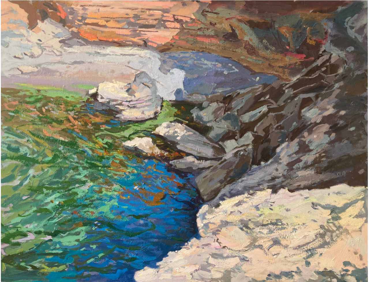
Daniel Menéndez Isturiz Roca y mar . Óleo sobre lienzo, 89 x 116 cm.