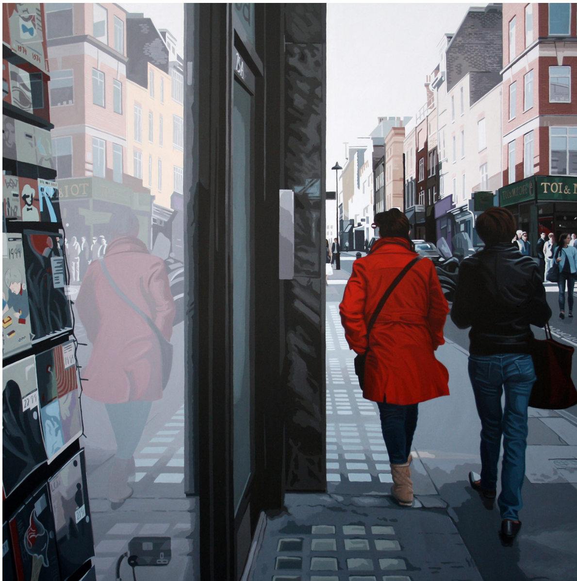
Rosa Ana Martos Sitcha Reflejos XVI. Londres. Acrílico sobre tabla, 146 x 146 cm.