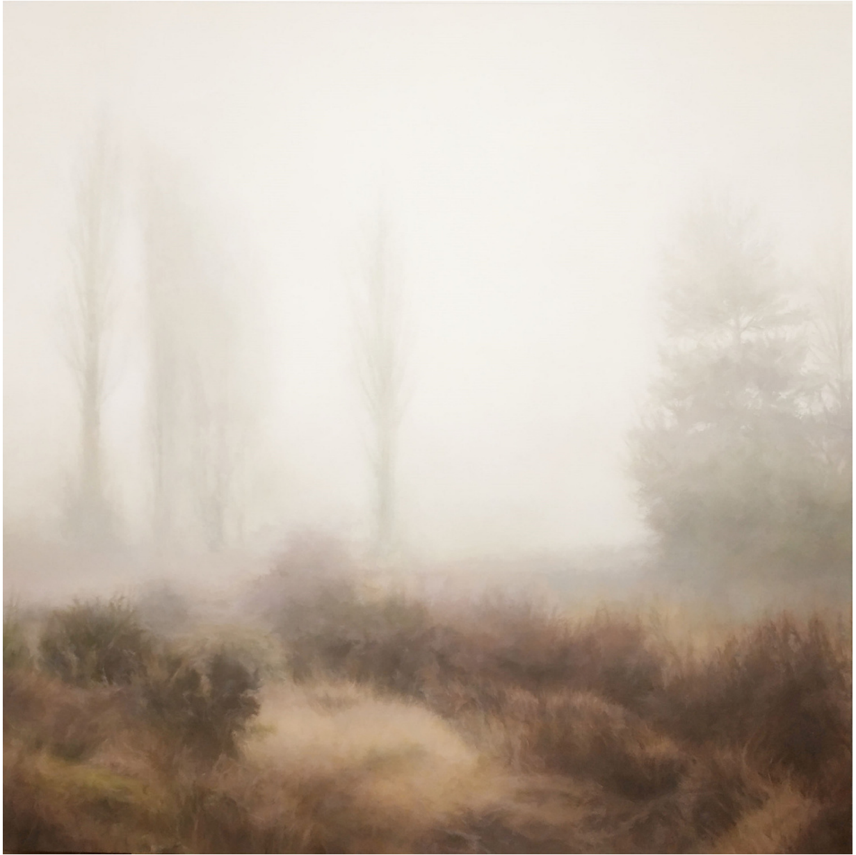
Guillermo Sedano Vivanco Sueño de luz . Óleo sobre lienzo, 146 x 146 cm.