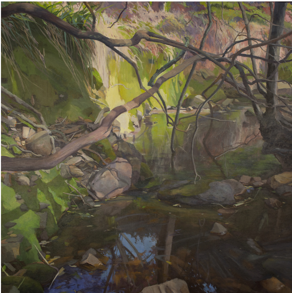
José Luis Mancilla Angulo Regato . Óleo sobre lienzo, 100 x 100 cm.