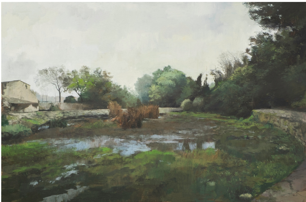
David Serrano Díaz La aceña . Óleo sobre lienzo, 65 x 100 cm.