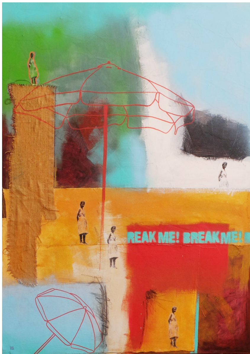
Jesús Rosa Martínez Un buen día de playa . Técnica mixta sobre tabla, 130 x 97 cm.