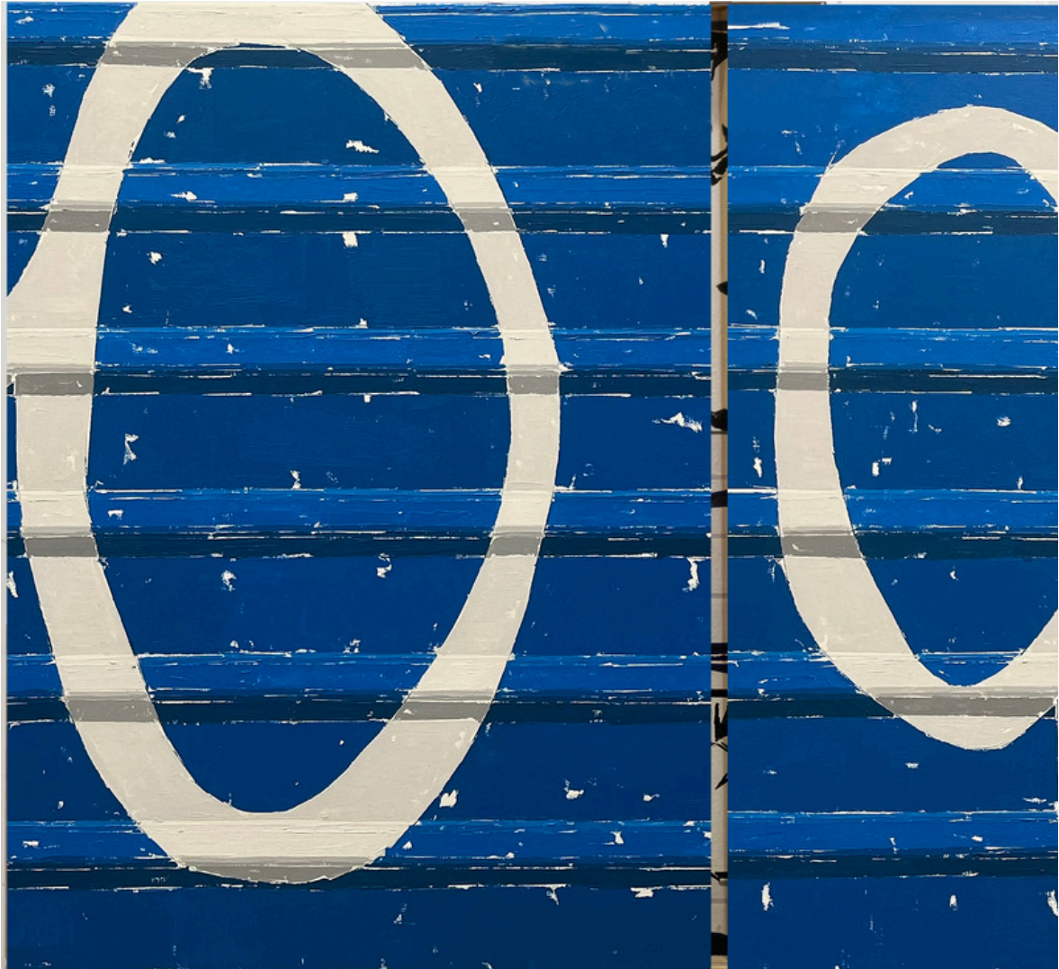
Andrés Aparicio Castellano Paisaje con esfinge . Óleo sobre lienzo, 60 x 70 cm.