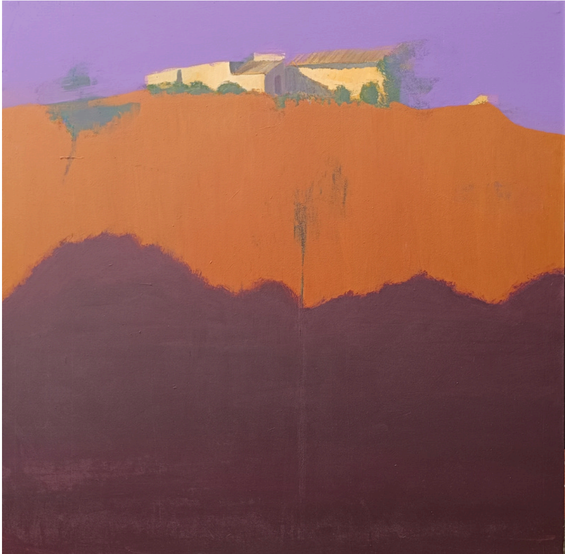
Santiago Castillo Trigos Ermita de San Roque . Acrílico sobre lienzo, 130 x 130 cm.