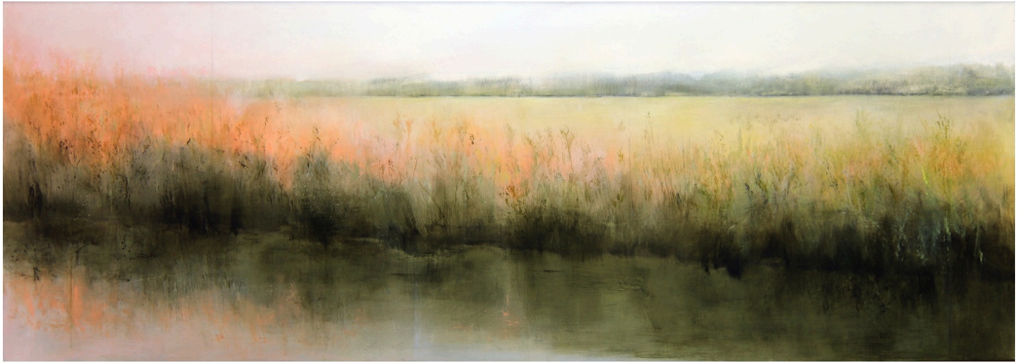
Cristina Díaz García Orilla . Acrílico sobre tabla, 50 x 140 cm.