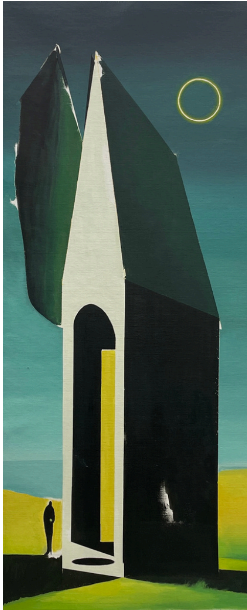
Israel Tirado García El hombre del mar . Óleo sobre madera, 50 x 120 cm.