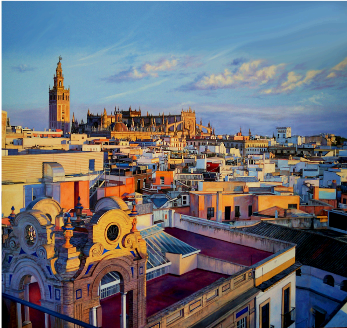
Christian Castro Martínez Atardecer en Sevilla . Óleo sobre tabla, 130 x 122 cm.