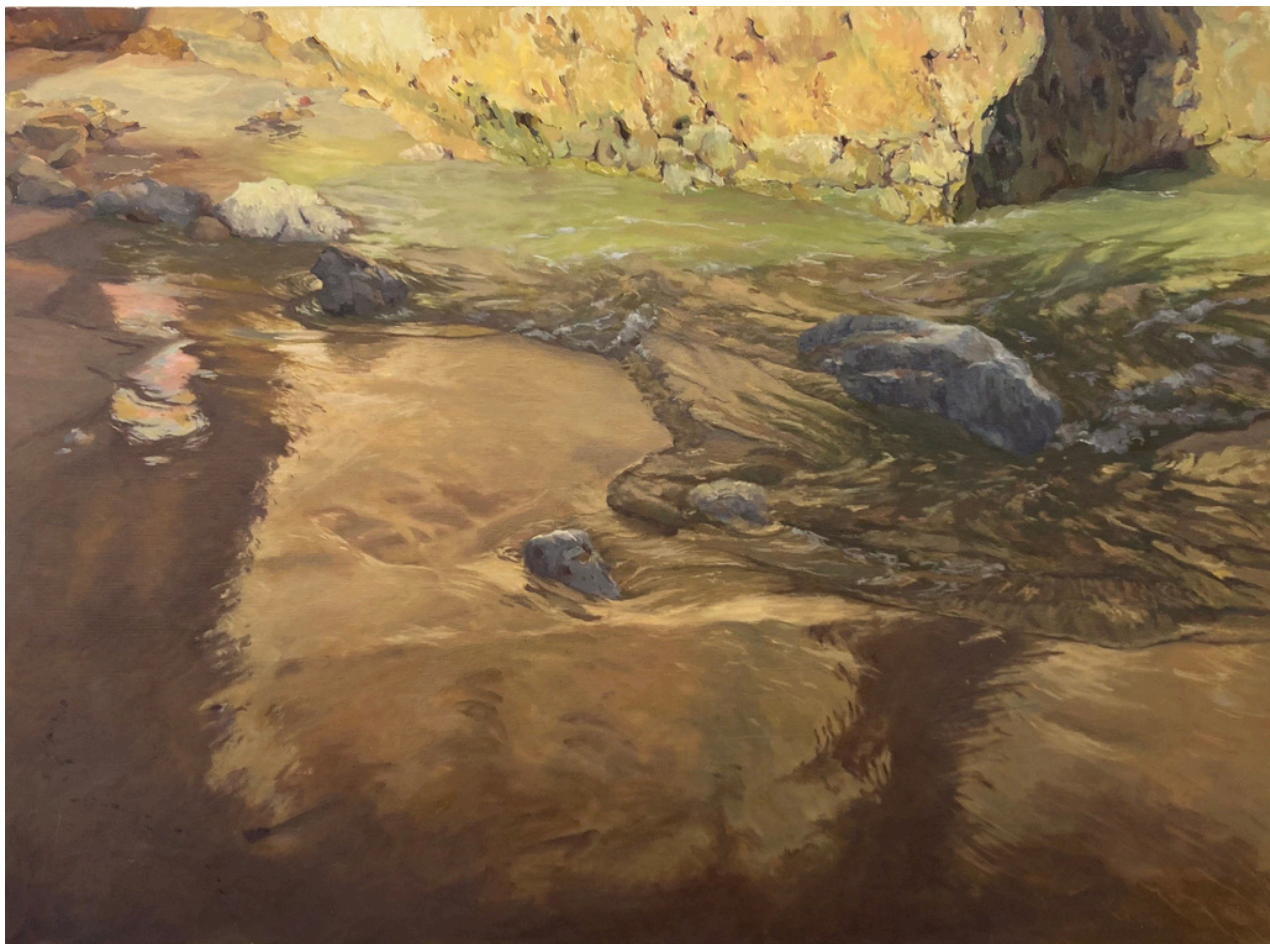
José Luis Mancilla Agudo Praia do Camilo. Óleo sobre lienzo, 73 x 100 cm.