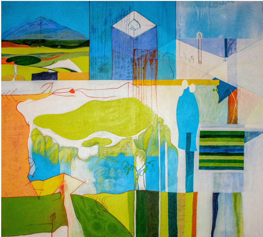
Francisco Javier Montes García La Muela 3x21, un relato tricrómico. Acrílico sobre lienzo, 145 x 131 cm.