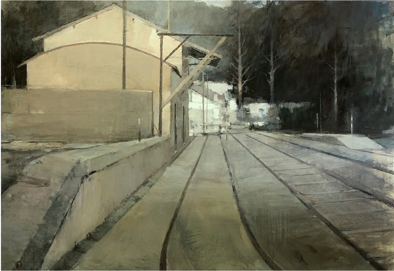
Francisco Martín Barea Estación de Cazalla . Acrílico sobre lienzo, 81 x 116 cm.