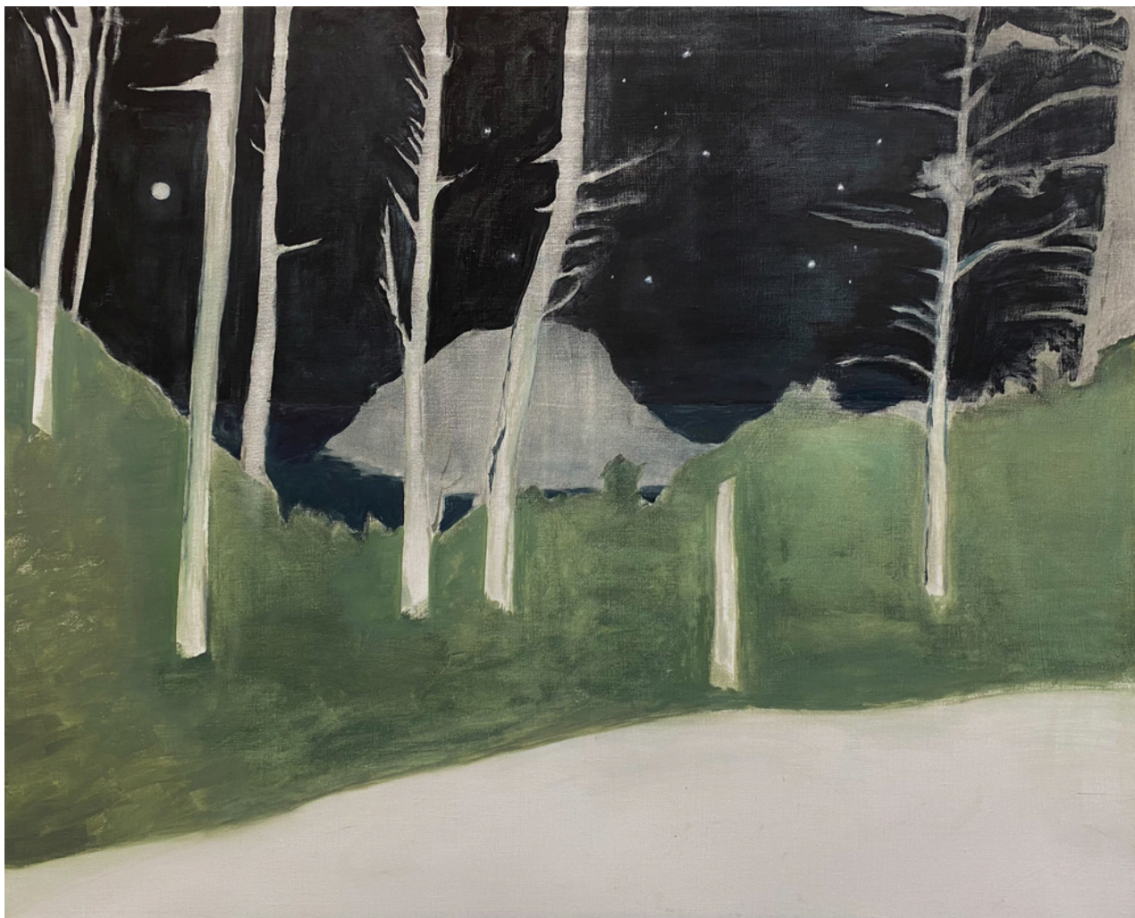
Rocío Olalla Villar Canobolas . Óleo sobre lino, 81 x 100 cm.