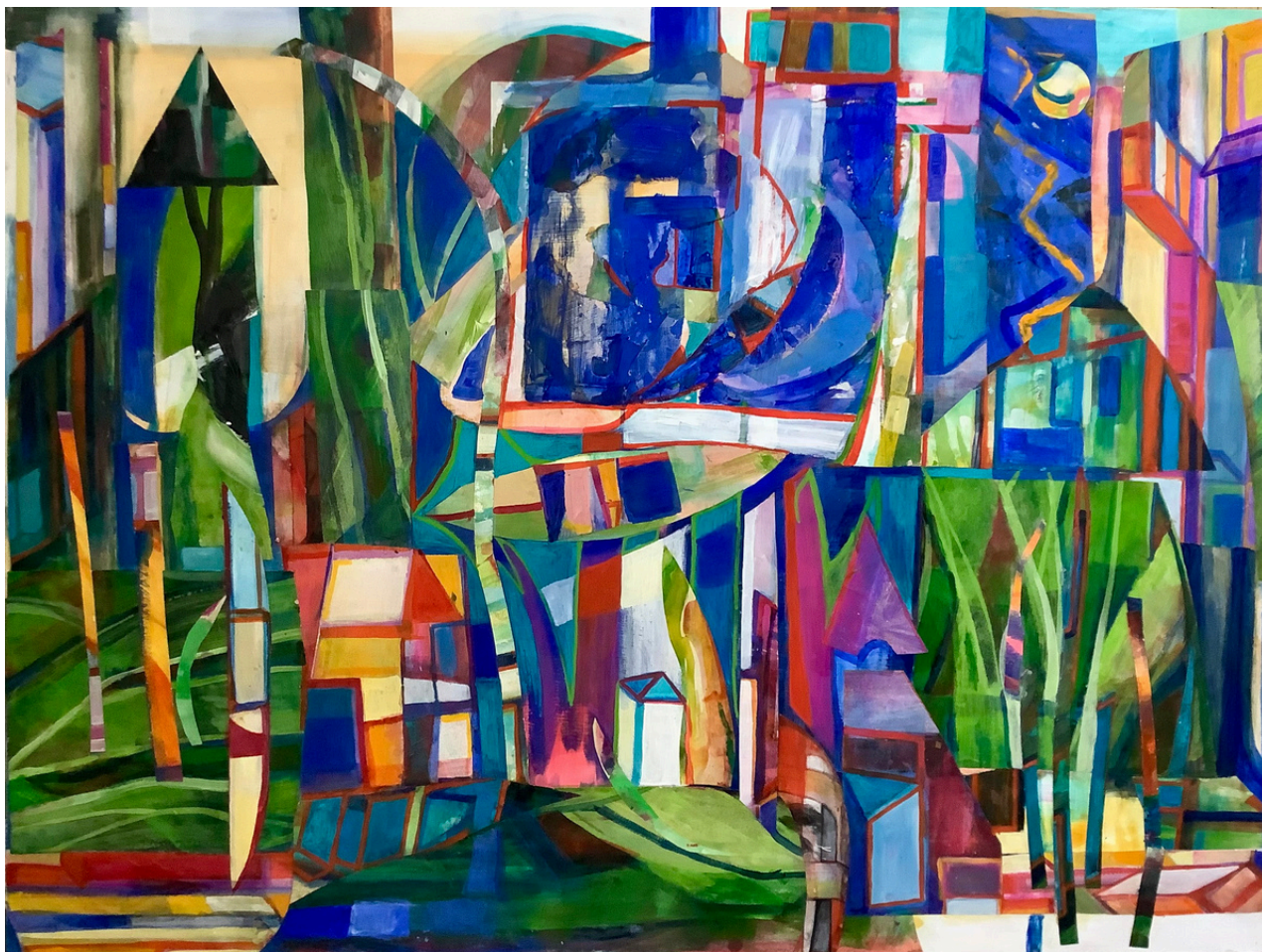
Leonor de Carlos Bermudo Promenade . Técnica mixta sobre tabla, 90 x 120 cm.