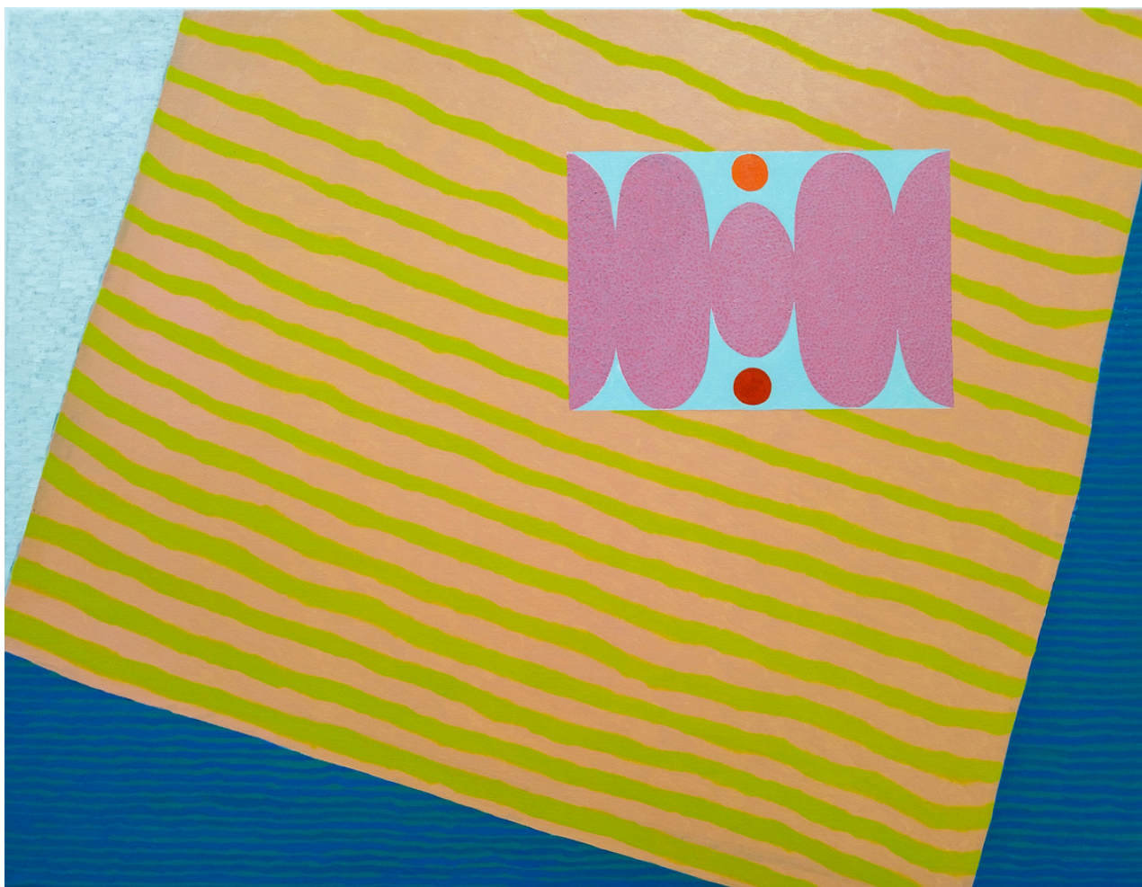
Federico Jaime López El último verano . Óleo sobre lienzo, 89 x 116 cm.